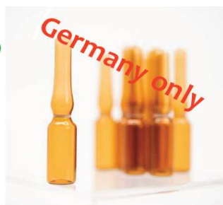
Methanol-d 4 99.8%D